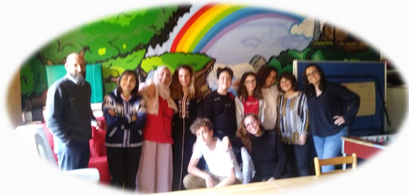
Foto di gruppo con i ragazzi e i responsabili della Casa Famiglia.