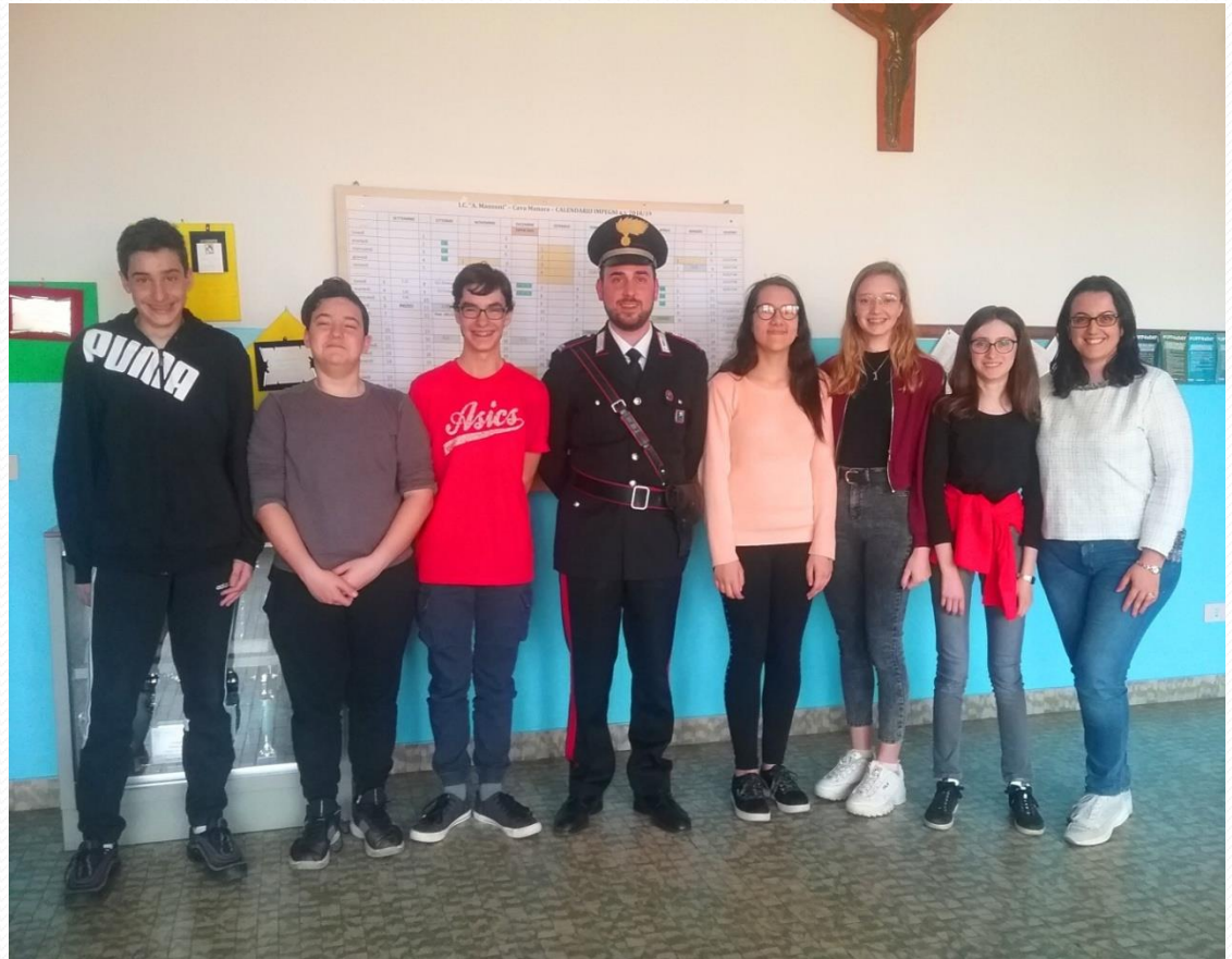
I ragazzi e il Maresciallo in posa per la foto nei locali della secondaria della sede di Zinasco Vecchio.